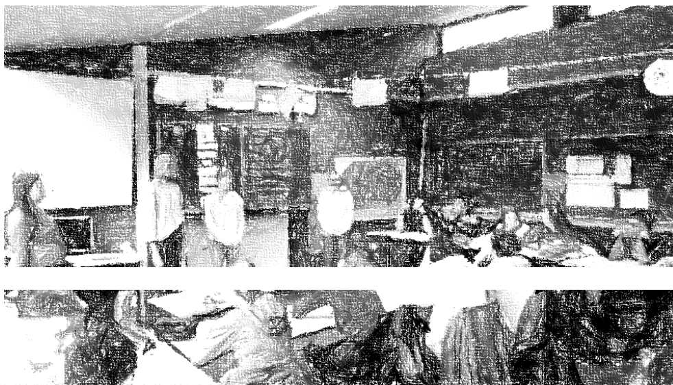
Abbildung 1: Screenshot aus dem Video

Ausschnitt aus einer Klassensituation im Fach Deutsch: zwölf Schüler*innen einer achten Klasse mit dem Förderschwerpunkt Lernen. Klassenlehrer und Integrationskraft sitzen vorne. Der Unterricht wird von vier Studierenden gestaltet und durchgeführt. In der gezeigten Sequenz wird mit verschiedenen Materialien, Tafel, Karten, Zetteln und Beamer gearbeitet. Die Audioqualität des Videos ist nicht sehr gut, da das Kameramikrofon, das in einer Ecke des Klassenzimmers steht, genutzt wird. Des Weiteren gibt es viele Störgeräusche wie Nebengespräche, Stühlerücken etc. Zu Anonymisierungszwecken sind die Namen der Schüler*innen nachträglich gemutet worden. In den Untertiteln werden Nummerierungen verwendet.